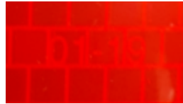
Tabla A - Retrorreflectividad

Ejemplo de mes y año de fabricación que exige la norma colombiana.