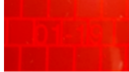
Tabla A - Retrorreflectividad

Ejemplo de mes y año de fabricación que exige la norma colombiana.